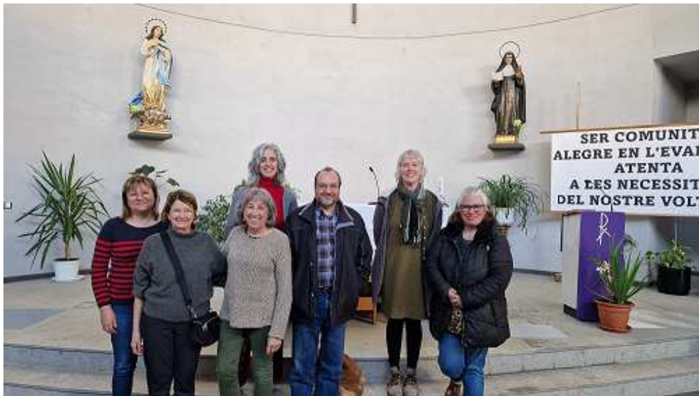
Trobada a la parròquia de Santa Teresa Jornet (Cappont), el 24 de febrer de 2024

Els Animadors de Comunitat són homes i dones laiques que volen posar-se, una vegada formats, a disposició del Sr. Bisbe per a ser nomenats, i que reuneixen unes condicions concretes per a poder accedir a aquesta formació. En aquests moments hi ha 26 Animadors de Comunitat.